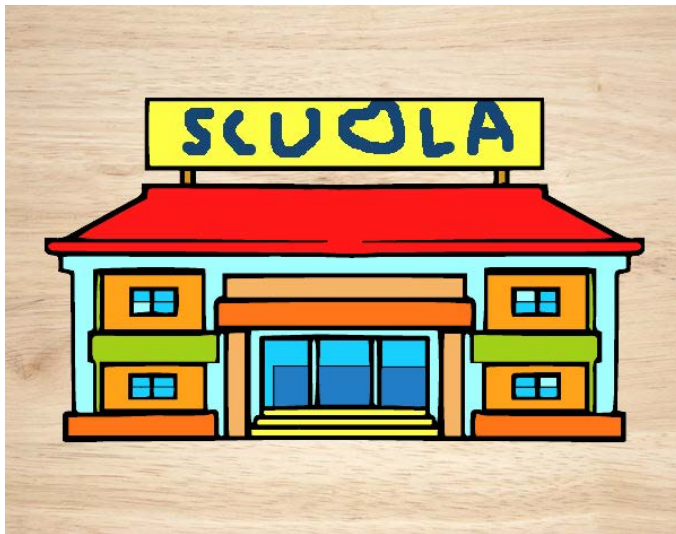
ISTITUZIONI SCOLASTICHE DI PRIMO E SECONDO GRADO